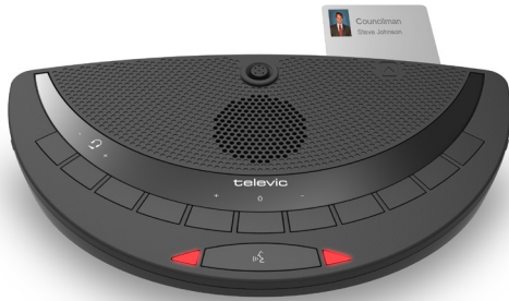
Confidea DV G3